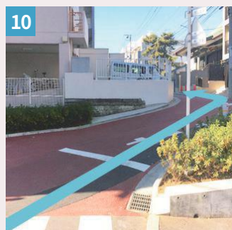
10 赤く舗装された曲がりくねった坂道を上ります。