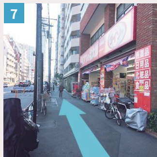
7 くすりの福太郎を右手に真っ直ぐ進みます。