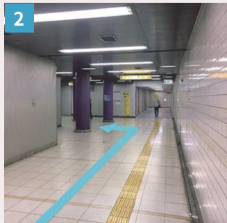
2 エスカレーターと階段を上り東口を目指します。