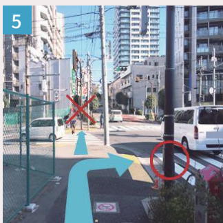
5 市ヶ谷柳町交差点を右へ曲がります。