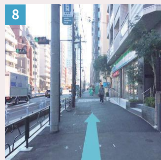
8 ファミリーマートを通り過ぎ、そのまま真っ直ぐ進みます。