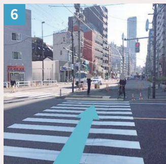
6 信号を渡り外苑東通りを約 300m 真っ直ぐ進みます。