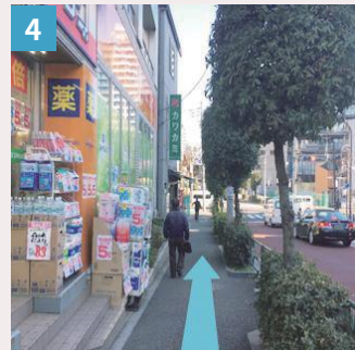
4 東口に隣接するミネラッグを左へ曲がり坂を下ります。