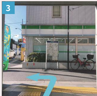
3 地上に出たら左へ曲がります。