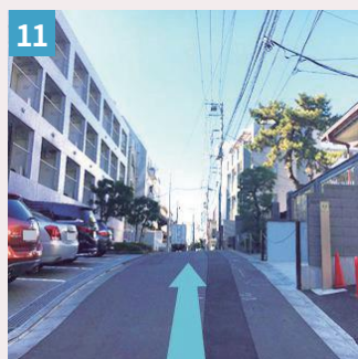
11 坂を上ったら約 100m 真っ直ぐ進みます。