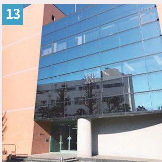
13 右エントランスを抜けて、左手にエレベーターがあります。3 階までお越してください。