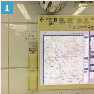
1 改札を出たら左へ進みます。