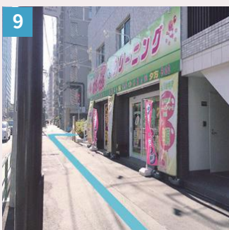
9 クリーニング店横の道を右へ曲がります。